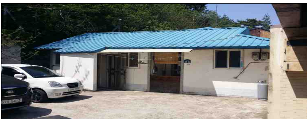
대성모텔옆 건물 2