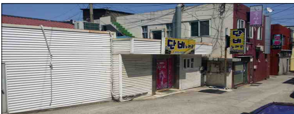
대성모텔옆 건물 3