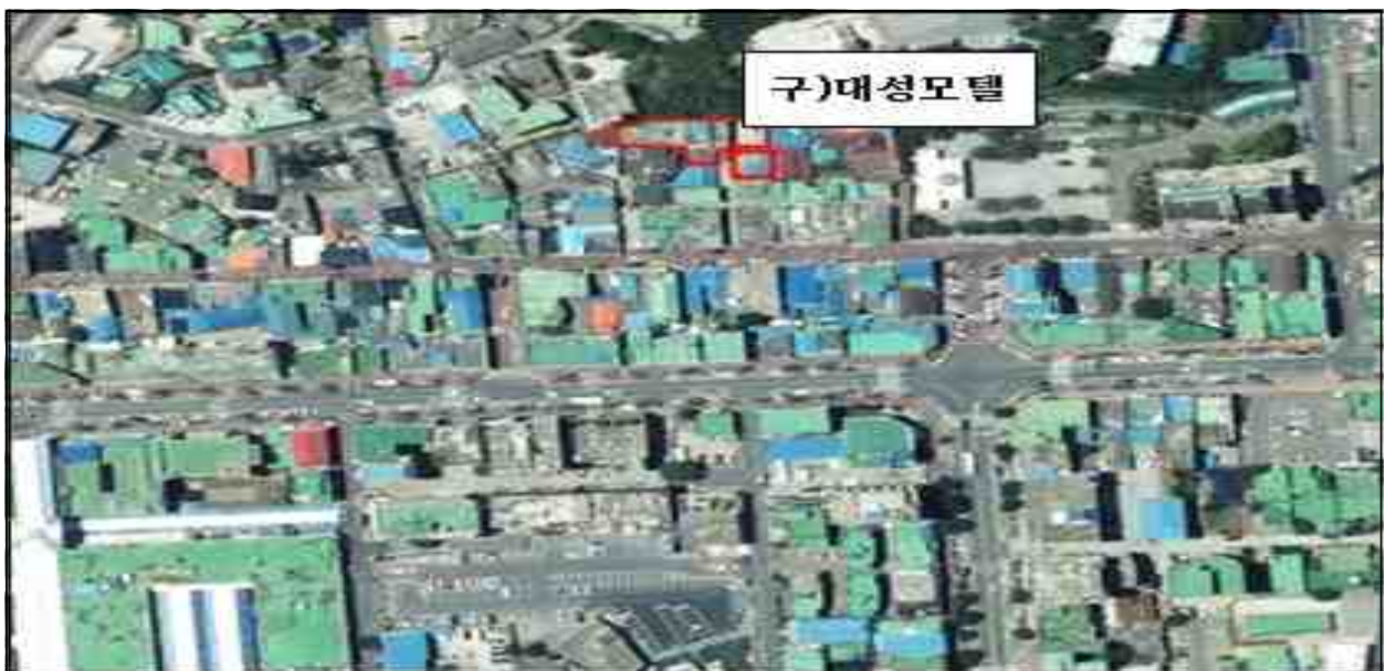
평 면 도