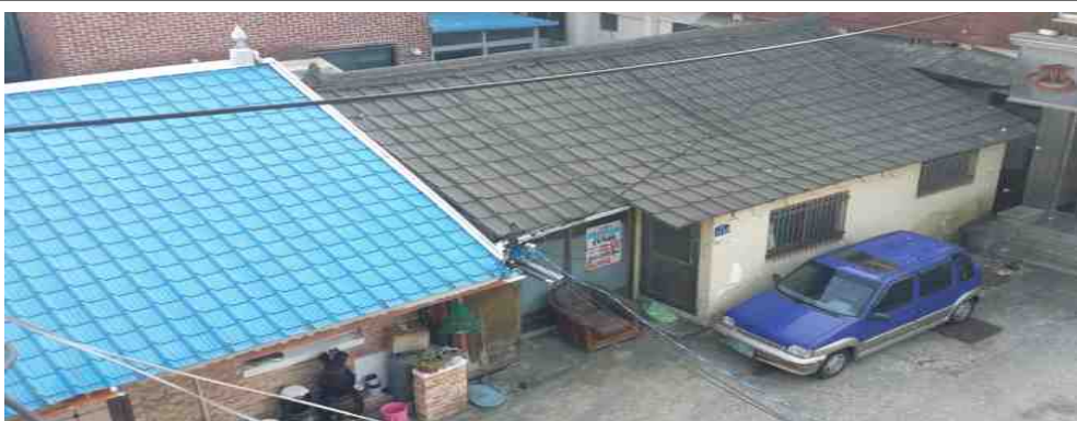
대성모텔앞 건물 1