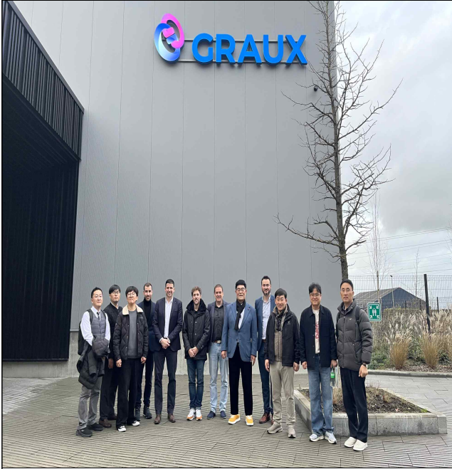
벨기에 지역 산업체(Graux) 방문