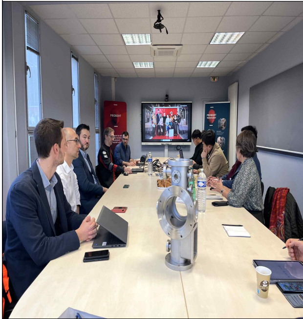
노르망디 지역 산업체(Probent) 방문