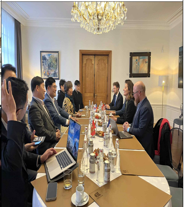
노르망디 지역 대표 미팅