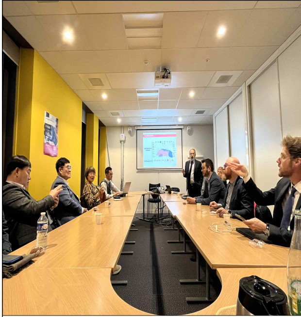
caen la mer(지역공동체) 대표 미팅