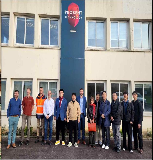
노르망디 지역 산업체(Probent) 방문