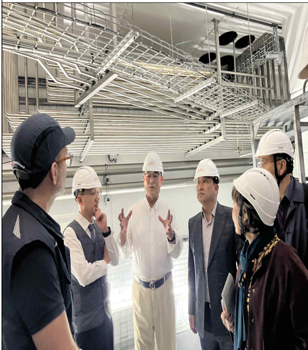
NHa C400 IONS 시스템 구축 현장