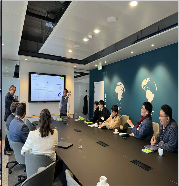
NHa 협력 전망 논의 간담